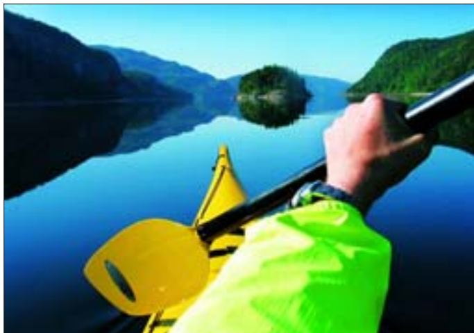
BLANKT: Sør for Tonstad. Astridsholmen rett fram.