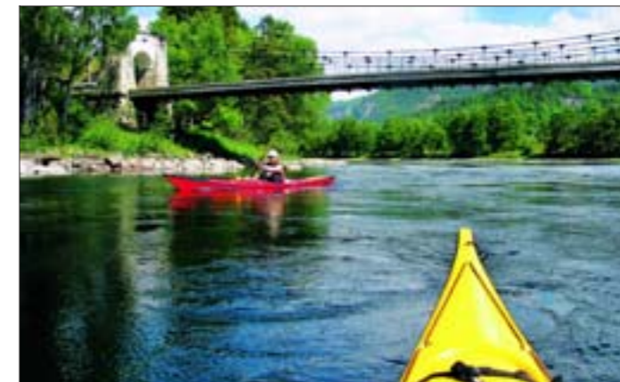
UNDER BRUA: Bakke bru var inntil årsskiftet 1945/46 en del av «Den Vestlandske Hovedvei» over Tronåsen.