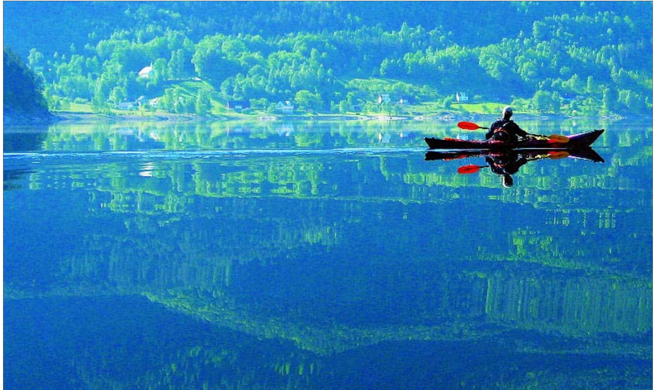
SPEIL: Stille over Sirdalsvatnet forbi Haughom