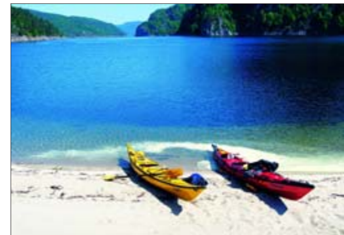
IDYLL: Jakt på den perfekte stranden endte på Mjåsund på vestsiden av Sirdalsvatnet.