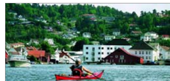
FRAMME: Etter ni timer: Flekkefjord med ankomst fra nord.